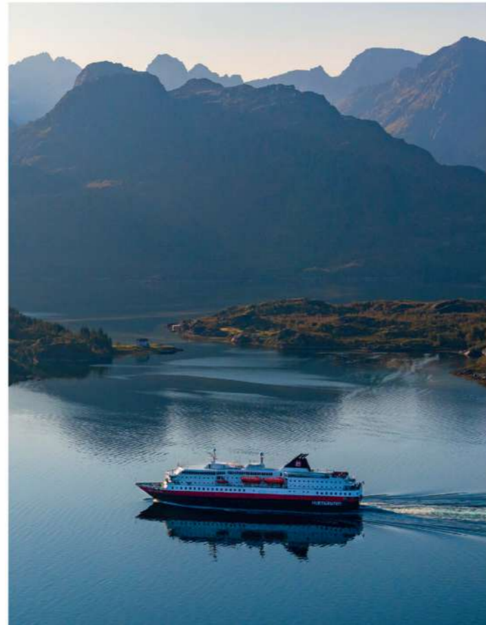
MS KONG HARALD

KABINEN: 216 und 2 Suiten BRZ: 11.204 BAUJAHR: 1993 LÄNGE: 12,8 Meter MODERNISIERUNG: 2016/2023 BREITE: 19,2 Meter WERFT: Volkswerft, Deutschland GESCHWINDIGKEIT: 15 Knoten